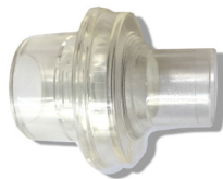
326 - Valve avec filtre intégré pour masque O2 - unité