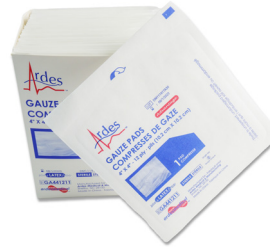
307 - Compresse stérile de 3 pouces paquet de 10