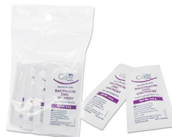
331 - Sachets d'onguent antibiotique - paquet de 12