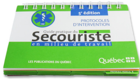
317 - Protocole de secourisme en français - unité