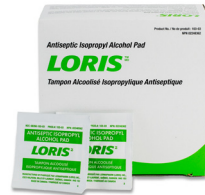
323 - Tampon d'alcool paquet de 10