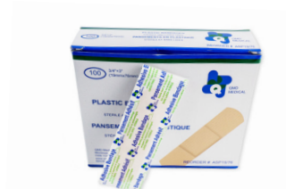
314 - Pansement adhésifs standard en plastique - paquet de 10