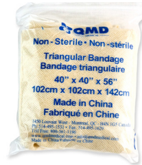
302 - Bandage triangulaire unité