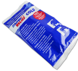
306 - Compresse froide instantanée - unité