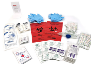
327 - Ajustement trousse de base - unité