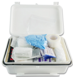
325 - Trousse pour véhicule dans une boîte en plastique - unité