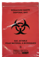
333 - Sac jetable pour pansements - unité