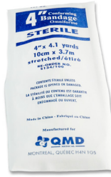
319 - Rouleau de gaze élastique stérile de 3 pouces - unité