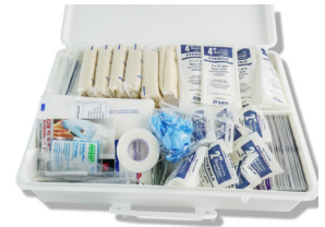
324 - Trousse d'établissement dans une boîte en plastique - unité