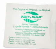
330 - Serviettes nettoyantes pour les mains paquet de 100