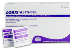
322 - Tampon benzalkonium antiseptiques paquet de 10