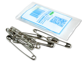
308 - Épingle de sûreté paquet de 12