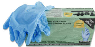
311 - Gants de nitrile médium paquet de 16