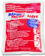
305 - Compresse chaude instantanée - unité