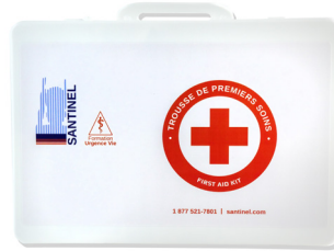
303 - Boitier vide pour trousse d'établissement unité