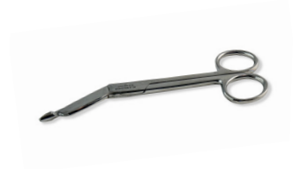
304 - Ciseaux en stainless de 5,5 pouces - unité