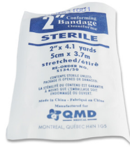
318 - Rouleau de gaze élastique stérile de 2 pouces - unité