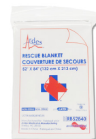
332 - Couverture de survie en aluminium - unité