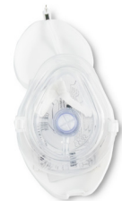
312 - Masque O2 avec valve, gants et étui rigide - unité