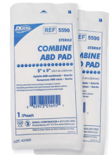
328 - Compresse abdominal stérile - unité