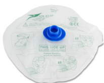
313 - Masque jetable avec valve bleu - unité