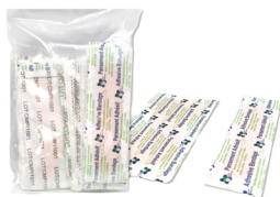
329 - Pansements adhésifs varié tailles assorties paquet de 25