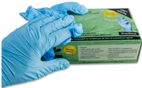
309 - Gants de nitrile extra-large - paquet de 16