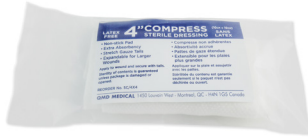
301 - Bandage de compression série de 4 pouces unité