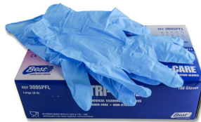
310 - Gants de nitrile large paquet de 16