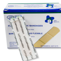
315 - Pansement adhésifs standard en tissu - paquet de 10